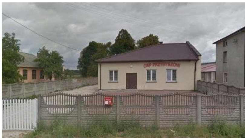
Zdjęcie 3. Budynek OSP Przybyszów

W miejscowości Przybyszów znajduje się strażnica Ochotniczej Straży Pożarnej. Misją Ochotniczej Straży Pożarnej w Przybyszowie jest prowadzenie działalności mającej na celu zapobieganie pożarom oraz współdziałanie w tym zakresie z innymi instytucjami. Strażacy aktywnie uczestniczą w akcjach ratowniczych. OSP w Przybyszowie zarejestrowane jest jako stowarzyszenie.