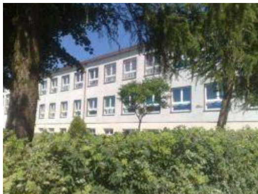
Zdjęcie 2. PG w Kobielach Wielkich.

- Publiczne Gimnazjum w Kobielach Wielkich