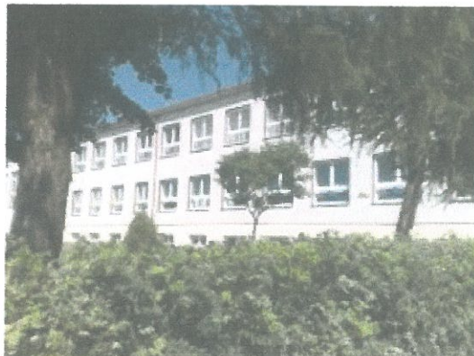
Zdjęcie 2. PG w Kobielach Wielkich.