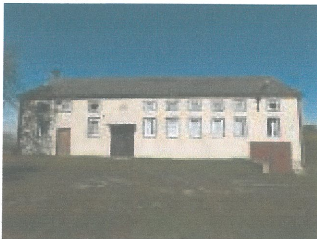
Zdjęcie 4. Strażnica OSP w Biestrzykowie Małym.

Małym zrzesz 29 czynnych członków – strażaków ochotników, w tym jedna kobieta. Ochotnicza Straż Pożarna w Biestrzykowie Małym posiada w swoich strukturach pięciu członków honorowych oraz jednego członka wspierającego.