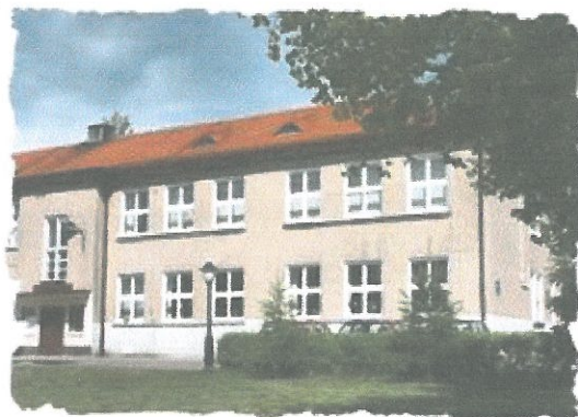
Zdjęcie 1. PSP w Kobielach Wielkich.