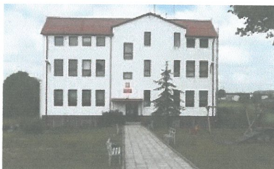
Zdjęcie 1. PSP w Orzechowie.

- Publiczne Gimnazjum w Kobielach Wielkich