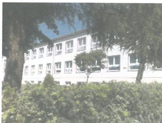
Zdjęcie 2. PG w Kobielach Wielkich.

- Publiczne Gimnazjum w Kobielach Wielkich