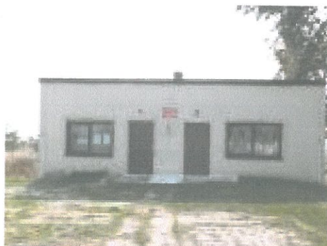
Zdjęcie 3. Świetlica Wiejska w Łowiczu.