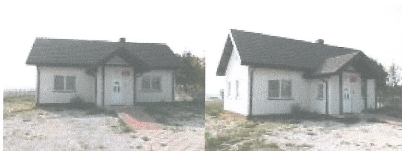
Zdjęcie 4. Świetlica wiejska w miejscowości Łazy.

W miejscowości Łazy funkcjonuje Świetlica Wiejska, która została utworzona przez Gminę Kobiele Wielkie i przekazana w struktury organizacyjne Gminnego Ośrodka Kultury i Sportu w Kobielach Wielkich. Świetlica została utworzona z myślą o mieszkańcach i stworzeniu lokalnej społeczności miejsca do wspólnych spotkań i integracji. Mieszkańcy miejscowości mają bezpłatny dostęp do obiektu. Świetlicą zarządza sołtys oraz rada sołecka.