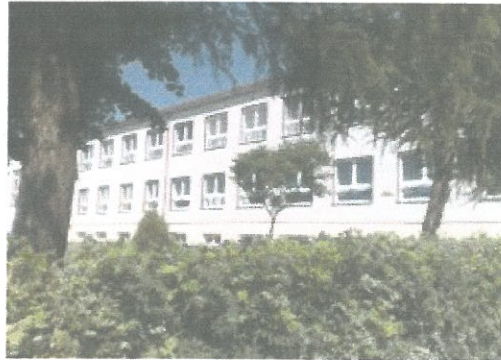
Zdjęcie 2. PG w Kobielach Wielkich.

- Publiczne Gimnazjum w Kobielach Wielkich