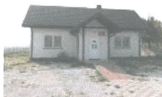
Zdjęcie 3. Świetlica wiejska w Łazach.

Poniżej zamieszczono fotografię świetlicy wiejskiej w Łazach.