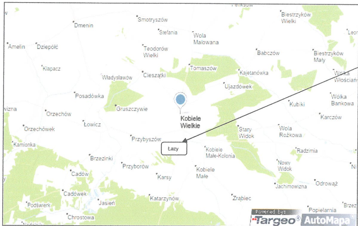
Mapa 1. Umiejscowienie Gminy Kobbiele Wielkie oraz Łazów.

Miejscowość Łazy znajduje się w odległości 11,3 km od Radomska i jest jedną z 30 miejscowości położonych w Gminie Kobbiele Wielkie. Znajduje się ona w południowej części województwa łódzkiego, w powiecie radomszczańskim. Łazy położone są w centralnej części gminy. W latach 1975-1998 miejscowość, jak i cała gmina należała do województwa piotrkowskiego.