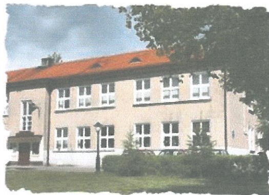
Zdjęcie 1. PSP w Kobielach Wielkich.