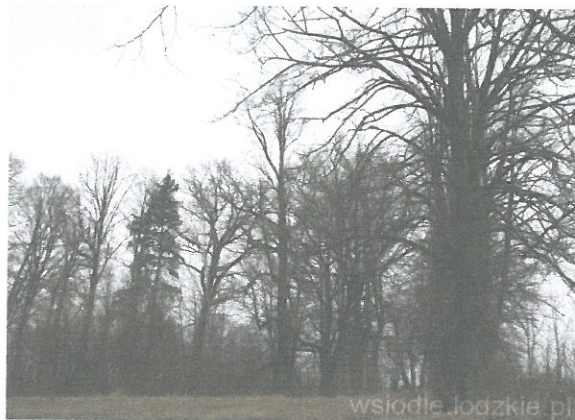
Zdjęcie 3. Park Dworski w Przyborowie.

Niewielki park dworski z XIX w. posiada wiele starych drzew, które posiadają rozmiary pomników przyrody. W parku rośnie wiele wspaniałych drzew liściastych, wśród nich najokazalsze to dęby, lipy, klony oraz akacje. Za starym drzewostanem rozciąga się polana. Dodatkowo na skraju parku znajduje się kapliczka słupowa.