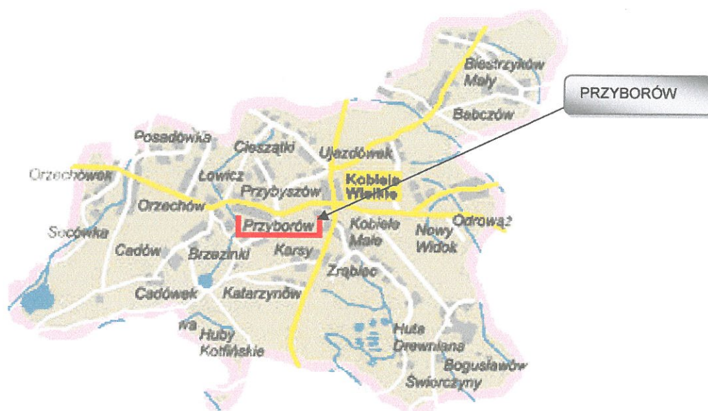
Mapa 2. Umiejscowienie Gminy Kobbiele Wielkie oraz Przyborowa.