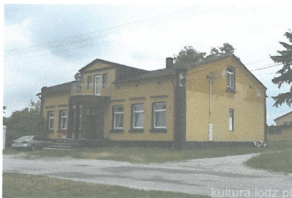
Zdjęcie 4. Dwór w Przyborowie.

Przed wejściem do parku znajduje się dwór z 1904 r. Jest to budynek murowany, wzniesiony na planie prostokąta, parterowy, z użytkowym poddaszem i dwuspadowym dachem. W środkowej jego części, nad wejściem znajduje się półokrągły taras wsparty na czterech filarach.